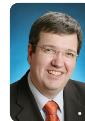
Лутц Лунгвиц Председатель «Немецкая ассоциация здоровоохранения»

Чем раньше начинается профилактика, тем лучше!